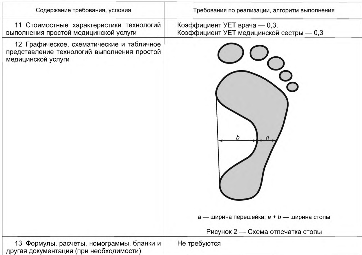
Окончание таблицы 4